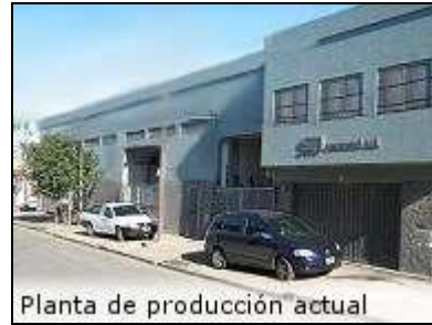
Planta de producción actual