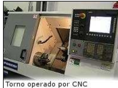
Torno operado por CNC

Creemos en la continua inversión y en la tecnología de punta como herramientas para beneficio de nuestros clientes, otorgando mecanizados a precios más competitivos, de mejor calidad y en tiempos de entrega más cortos.